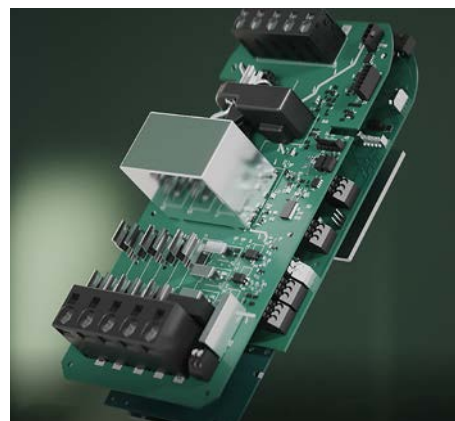
Technagon Ladecontroller (5. Generation)