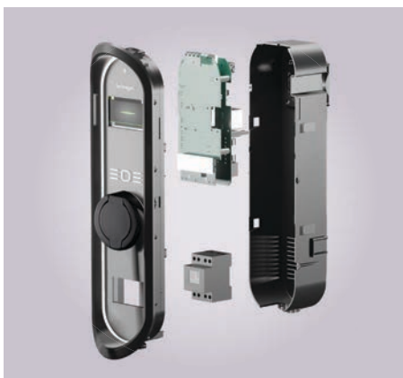
Technagon Lademodul (ERK)