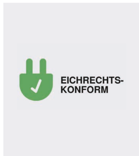
Eichrechtskonform (ERK) als Standard