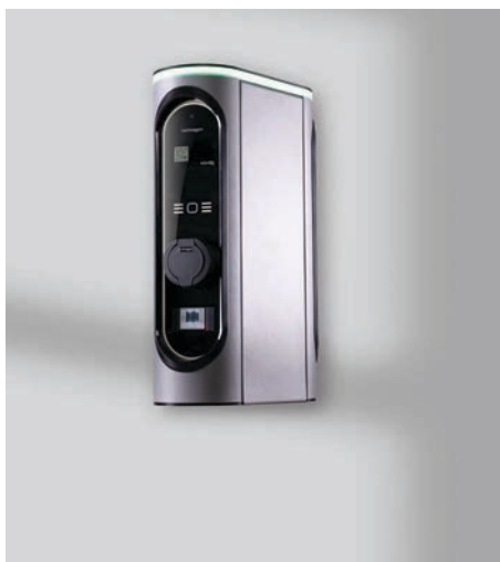
Mit Ladedose als Standard