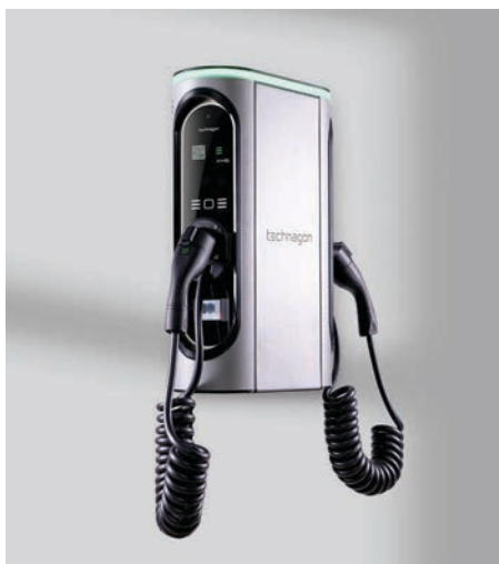
Mit Spiralkabel als Option